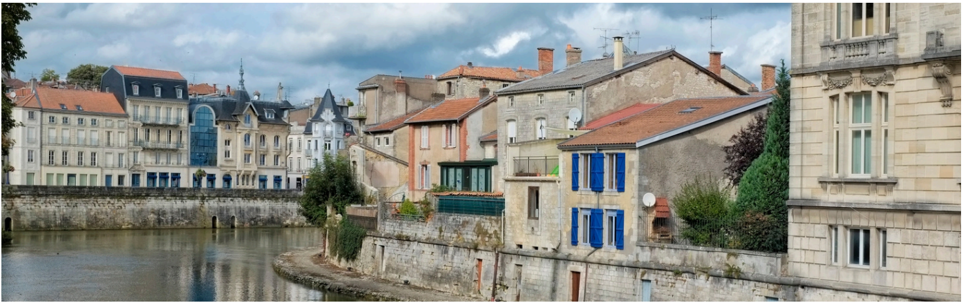
La Meuse à Verdun

OYEZ, OYEZ BONNES GENS, QU'ON SE LE DISE ! IL RESTE ENCORE QUELQUES PLACES POUR LE VOYAGE ORGANISÉ PAR LE CLUB